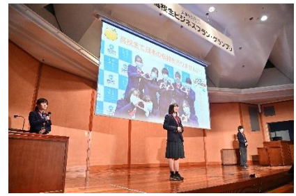
【プレゼンテーションの様子】

(※) 最終審査会の様子や岸田内閣総理大臣からのビデオメッセージは、以下のURLよりご覧いただけます。